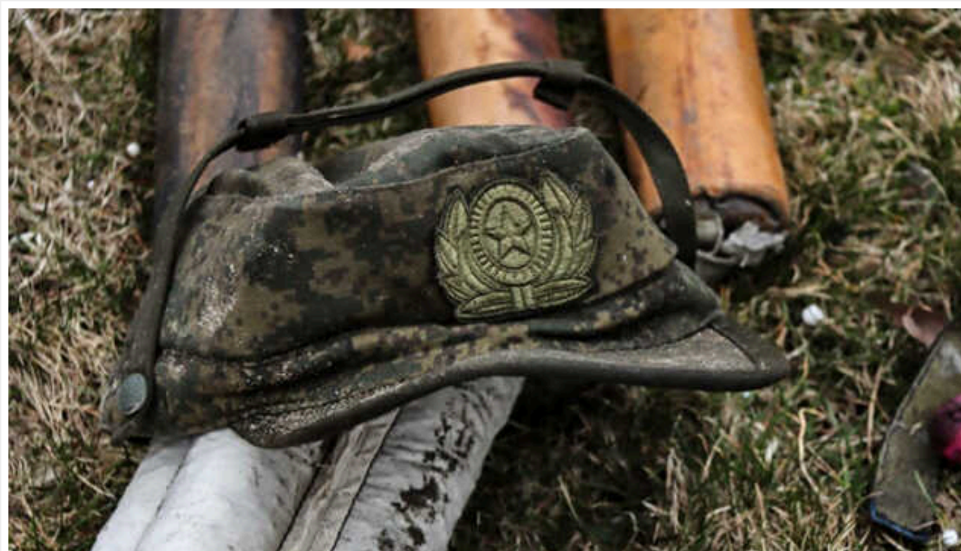
У Непалі заявляють, що РФ завербувала на війну в Україні понад 200 їхніх громадян

Росія завербувала понад 200 громадян Непалу для участі у бойових діях в Україні, щонайменше 14 з них загинули.