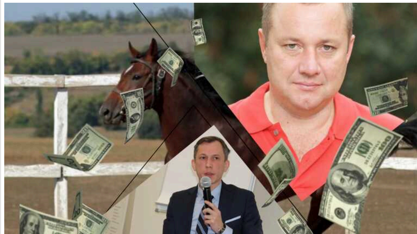
Скандал із коштами ФКСУ: знайдено російський слід

Скандал довкола Федерації кінного спорту України триває і обростає новими подробицями та скандальними фактами. Інформація про можливе нецільове використання мільйонів євро міжнародної благодійної допомоги сколихнула українську громадськість, а також кінну спільноту України та світу.