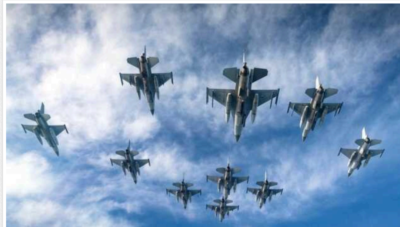
Сполучені штати чекають на підпис Ердогана під протоколом про вступ Швеції в НАТО, аби схвалити продаж F-16

Щойно президент Туреччини Реджеп Ердоган підпише закон про схвалення парламентом протоколу про вступ Швеції в НАТО, і цей документ доправлять у Вашингтон, Держдел США одразу надішле в Конгрес запит на продаж Туреччині вишищувачів F-16.