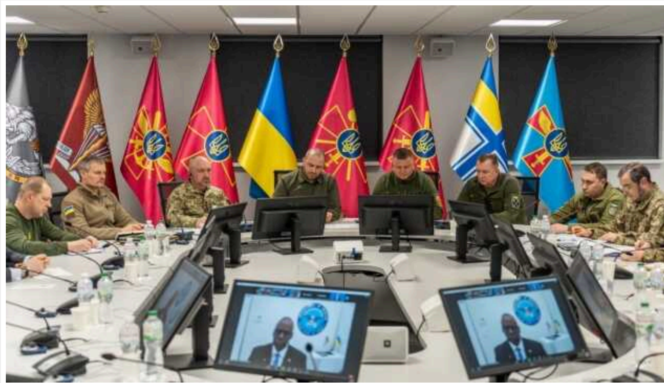
До коаліції дронів для України доєдналися Швеція та Британія