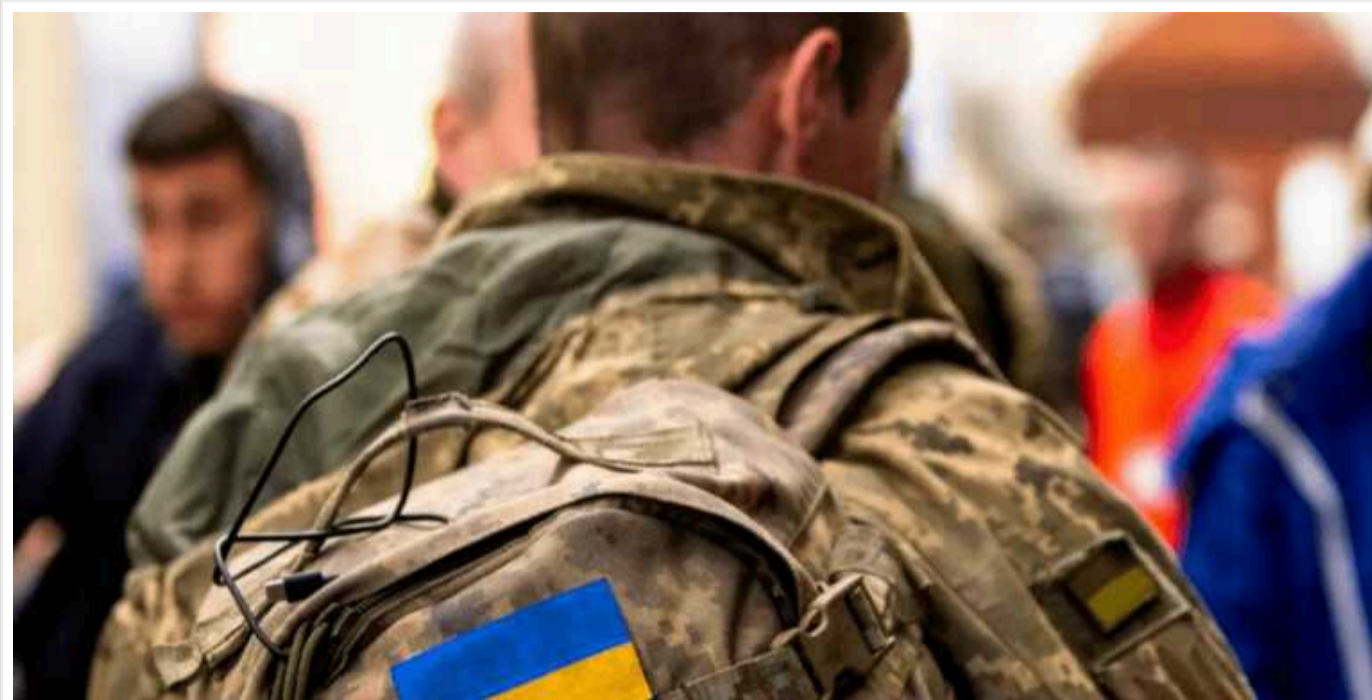
Мобілізація в Україні: Кого можуть призвати до армії з 1 лютого, а хто має право долучитись до Сил оборони лише за власним бажанням

Від початку повномасштабного вторгнення країни-агресора Росії на територію України, у нашій державі триває воєнний стан та загальна мобілізація населення. У цей період мобілізувати можуть чоловікі віком від 18 до 60 років.