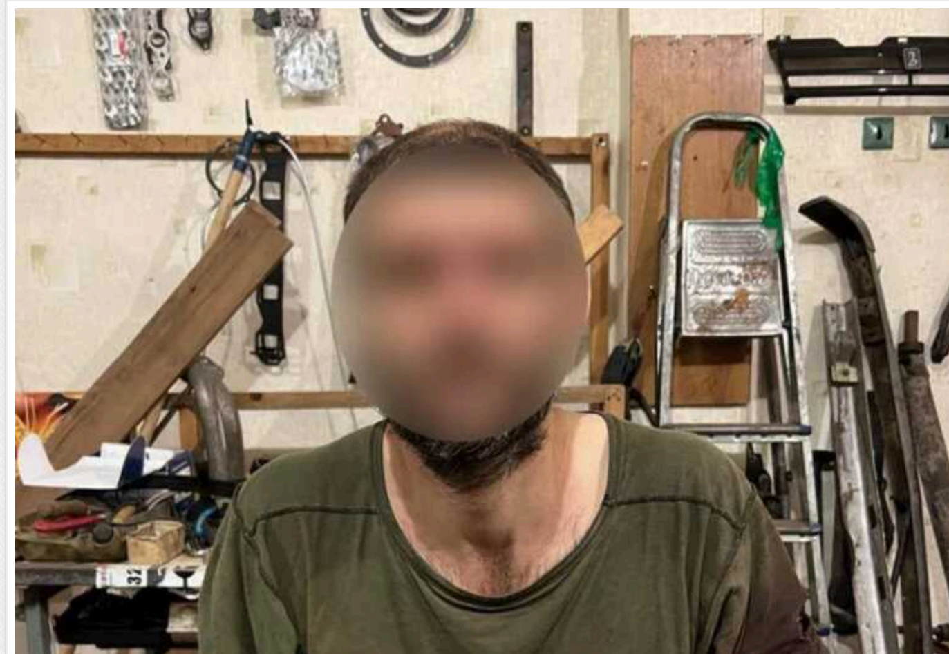
Зрадник із Криму, який воював проти України, отримав тюремний строк: добровільно вступив у ПВК "Редут"

Суд в Україні виніс вирок жителю тимчасово окупованого Криму, який добровільно вступив до лав ПВК "Редут", підпорядкованої ЗС РФ. Його визнано винним у державній зраді та засуджено до 15 років позбавлення волі з конфіскацією майна.