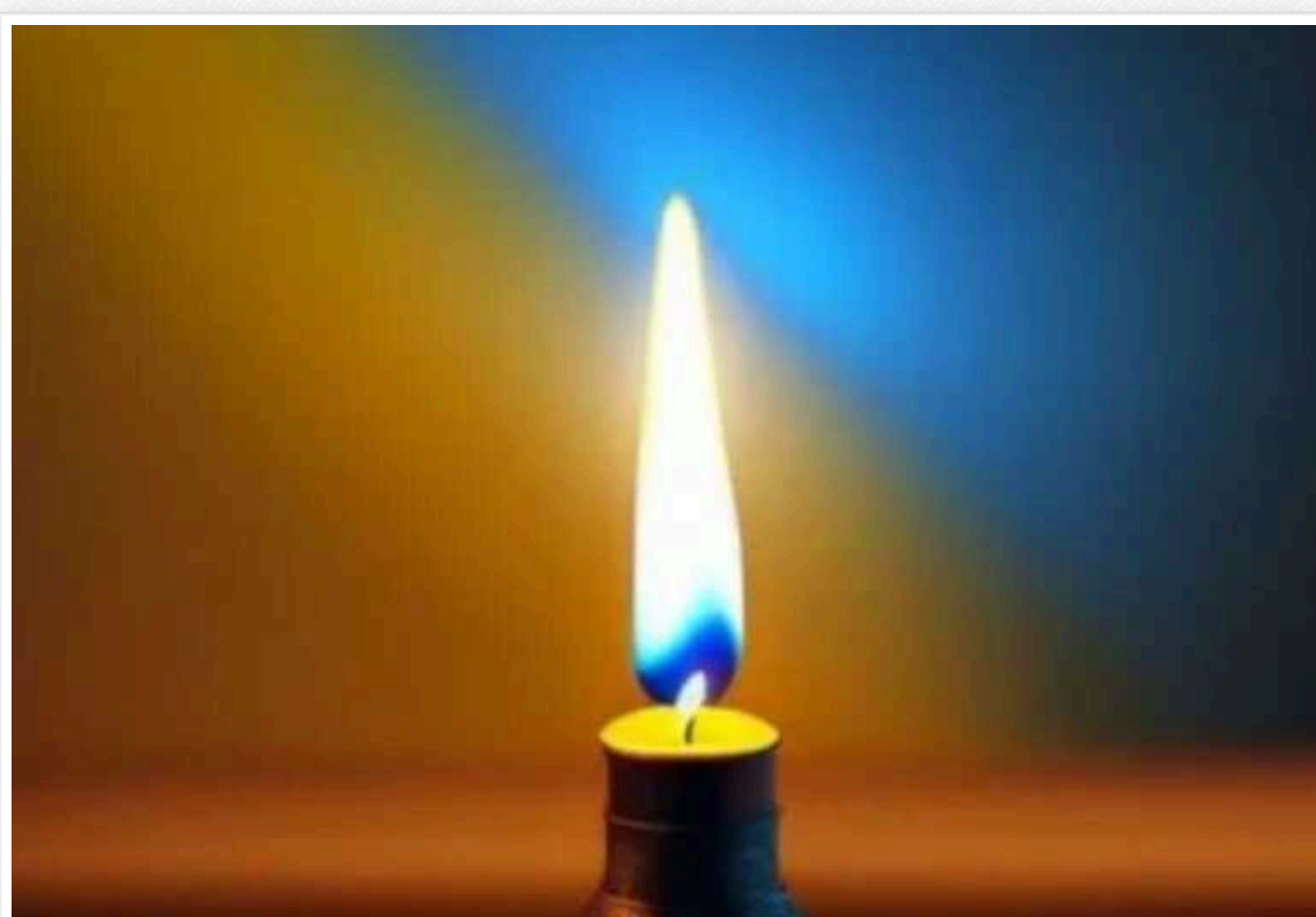
На Донеччині загинув захисник зі Львівщини: йому назавжди буде 28

На війні з російськими окупантами трагічно обірвалося життя солдата ЗСУ Петра Свинара зі Львівської області. Захисник загинув від ворожої ракети на Донеччині.