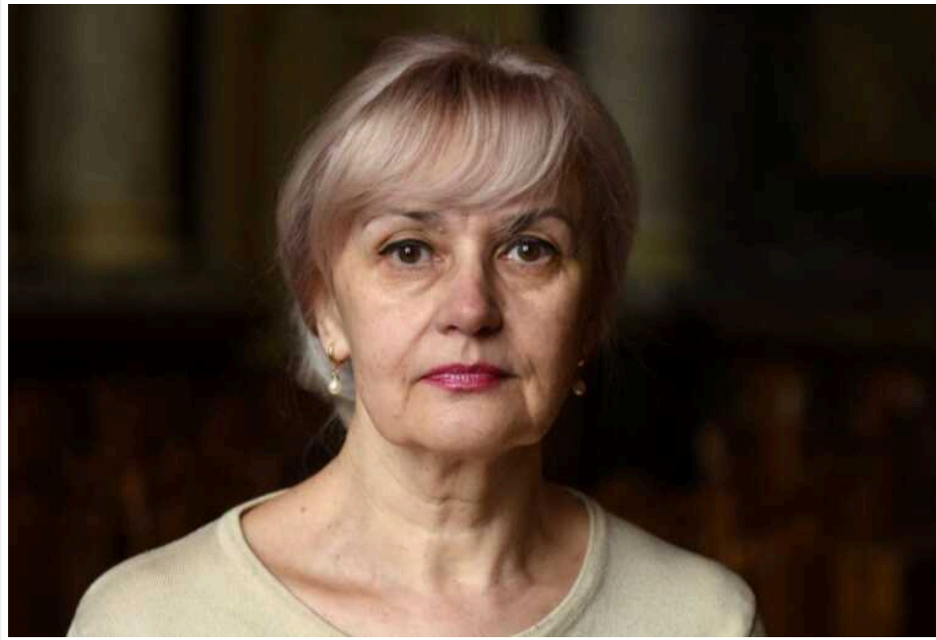
Фаріон висловилася про жорстку українізацію та новий виклик для мови

Україні сьогодні потрібна українізація. Щобільше, для української мови постає серйозний виклик.