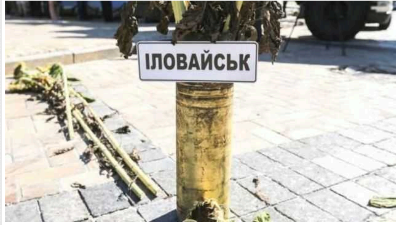
24 російські окупанти загинули під час удару по полігону під Іловайськом

24 січня близько 15.00 удар припав по території військової частини № 78528, що неподалік села Покровка.