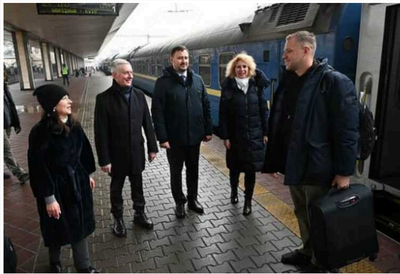
Глава МЗС Литви прибув до Києва

Міністр закордонних справ Литви Габріелюс Ландсбергіс прибув до України у четвер, 25 січня, для зустрічі з українськими посадовцями.