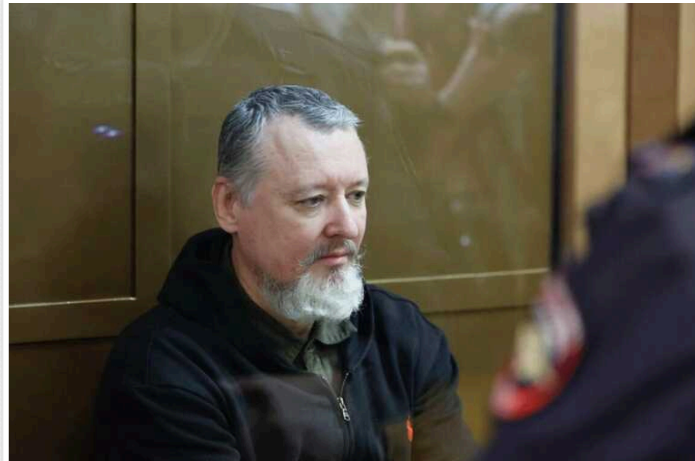
Московський суд засудив Ігоря Гірка-Стрелкова до чотирьох років колонії

Московський міський суд засудив російського терориста Ігоря Гірка (Стрелкова) до чотирьох років колонії загального режиму.