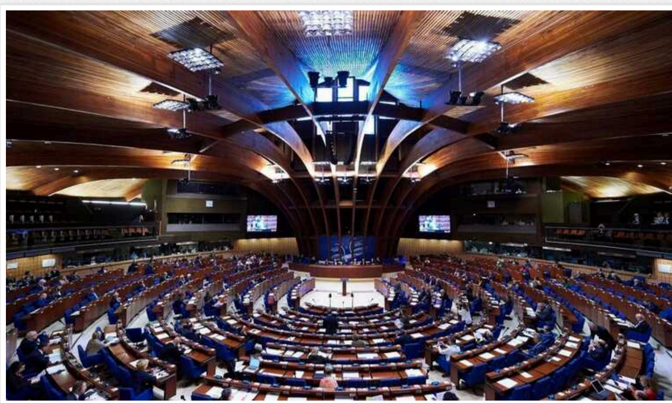
В ПАРЄ ухвалили важливу резолюцію щодо українських дітей

Парламентська асамблея Ради Європи схвалила резолюцію, що стосується українських дітей. Зокрема, резолюція закликає визнати депортацію українських дітей Росією геноцидом українського народу.