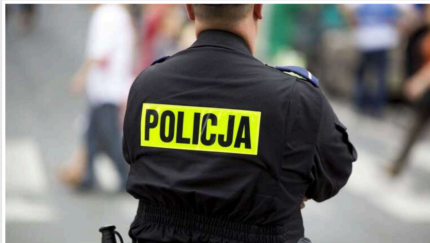
Українці є лідерами серед іноземців у Польщі за кількістю злочинів, - Rzeczpospolita