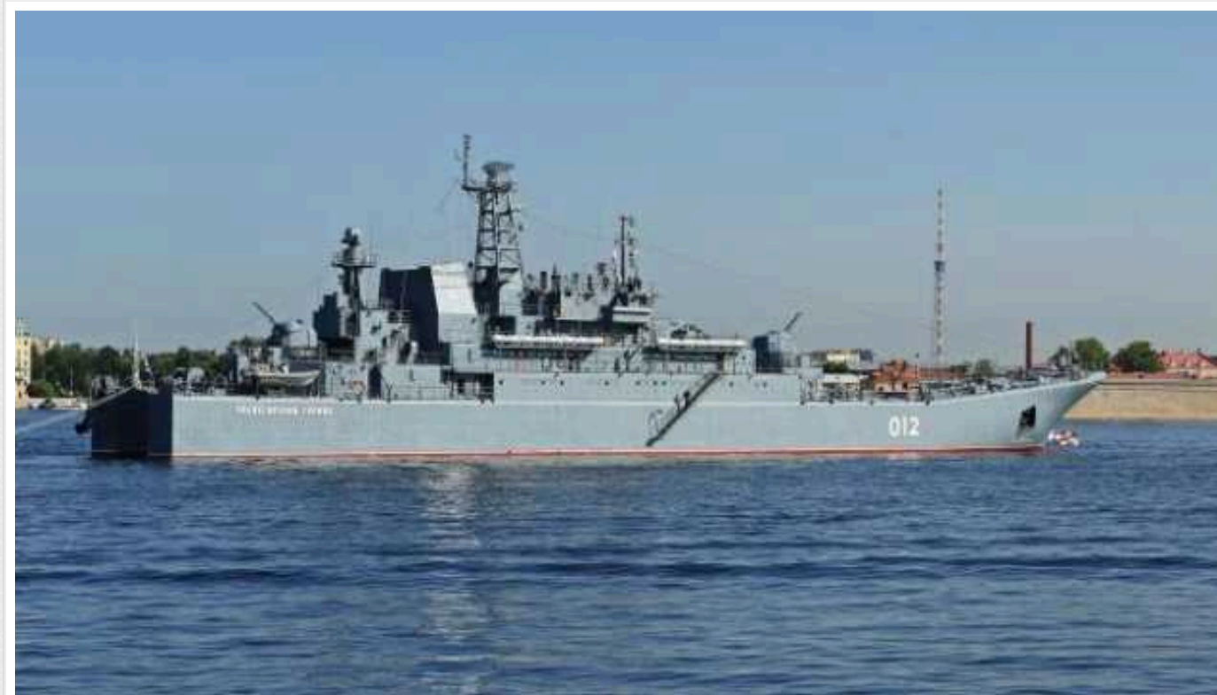
Росія перекинула до окупованого Севастополя «Оленегорский горняк» - ВМС

Російські окупанти перекинули великий десантний корабель «Оленегорский горняк» до Севастопольської бухти.