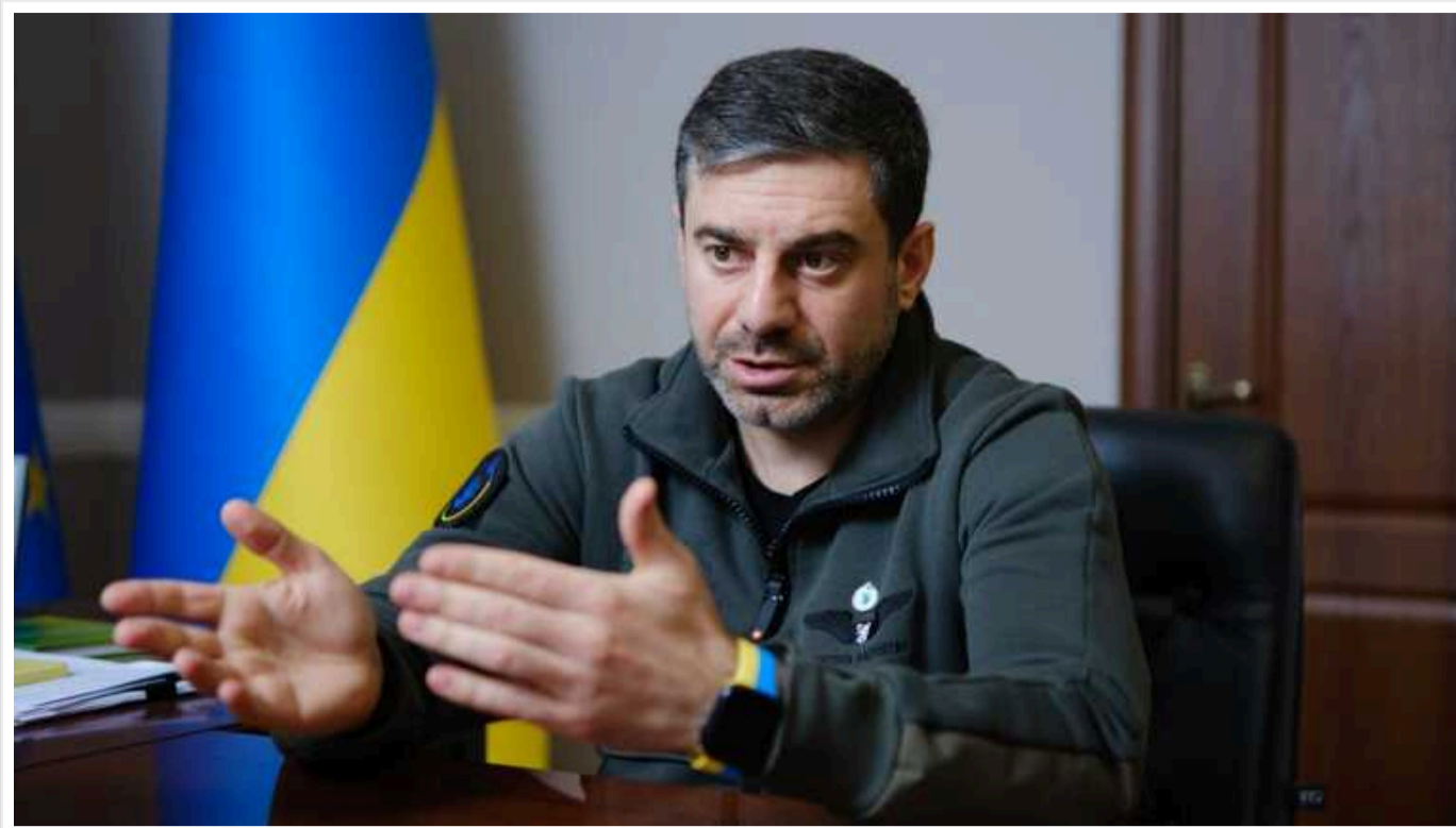
Не можна стверджувати, що на борту Іл-76, який впав у Белгородській області, були українські військовополонені. Це мають з'ясувати міжнародні експерти, – Лубінець

Наразі відсутні ознаки того, що на борту російського Іл-76 дійсно були українські військовополонені. Розслідуванням цього мають займатися міжнародні експерти.