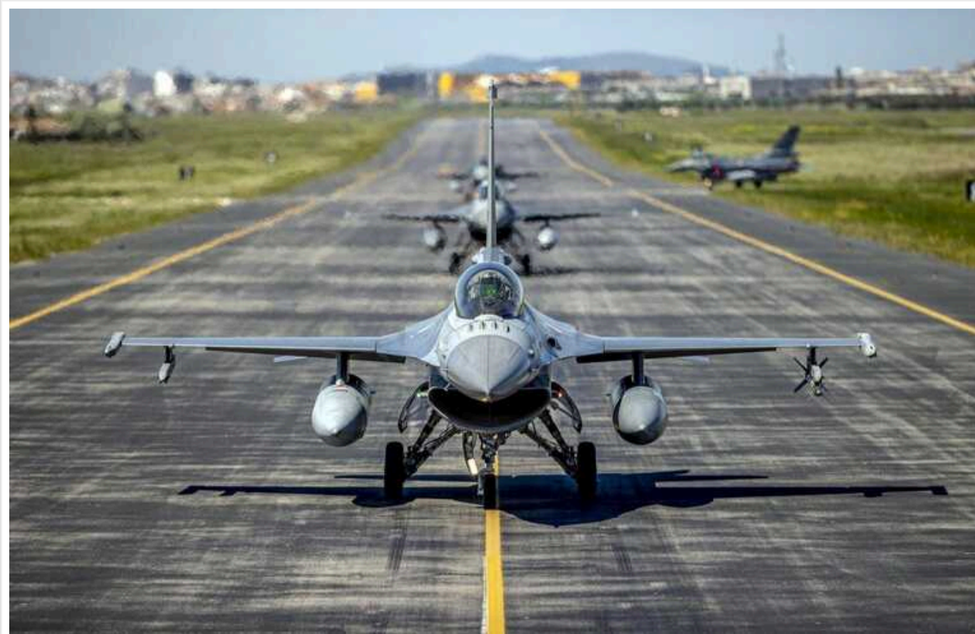
Партнери готові передати Україні F-16, але потрібно підготувати інфраструктуру та інженерів, – речник Повітряних сил

Країни-партнери вже готові передати перші винищувачі F-16, проте Україна має завершити підготовчі роботи.