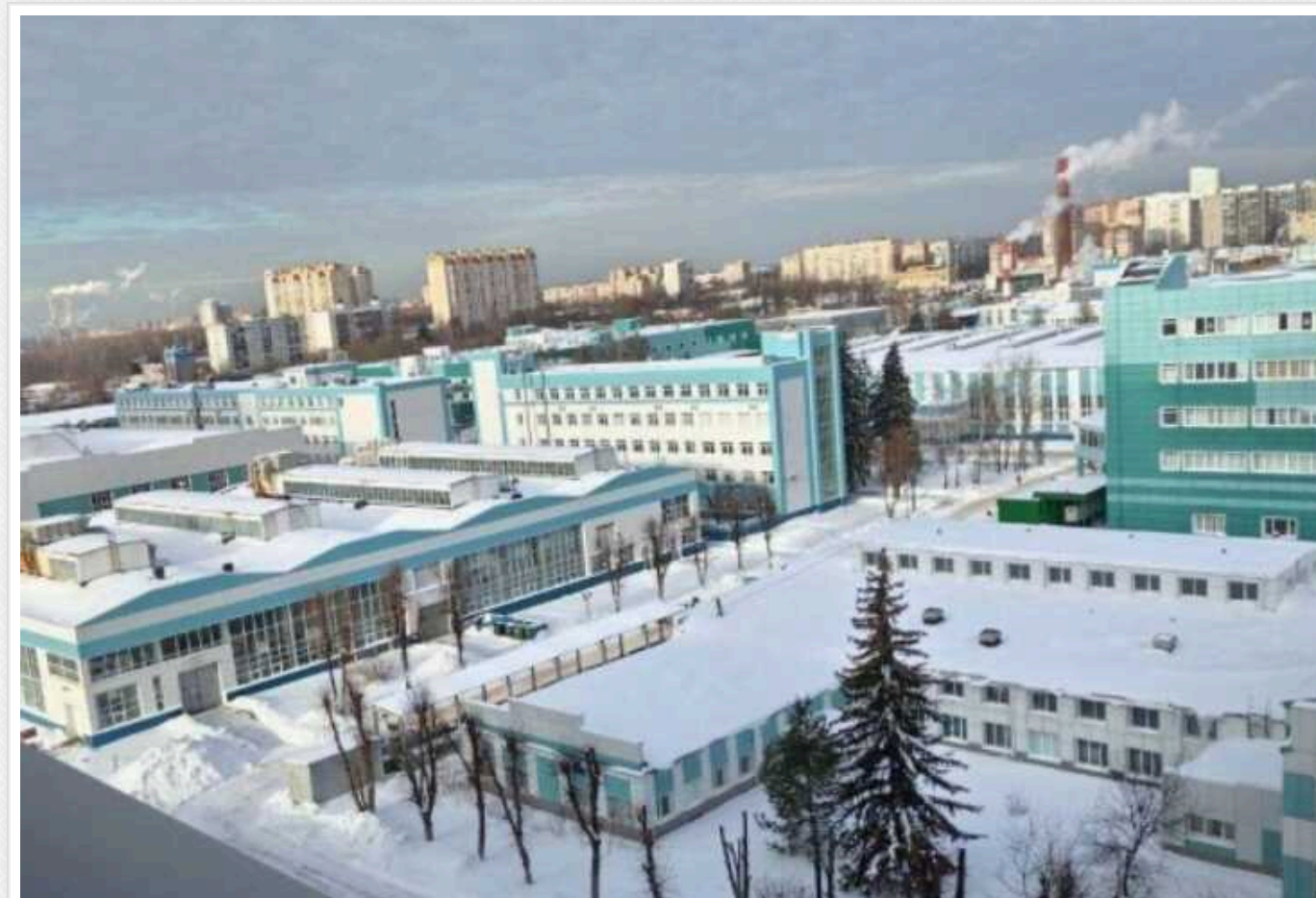
Партизани з "АТЕШ" розвідали територію корпорації з виробництва ракет під Москвою

Партизани розвідали територію корпорації "Тактичне ракетне озброєння" в Московській області (Росія). Це одне з найбільших підприємств російського оборонпрому, що займається виробництвом ракет.