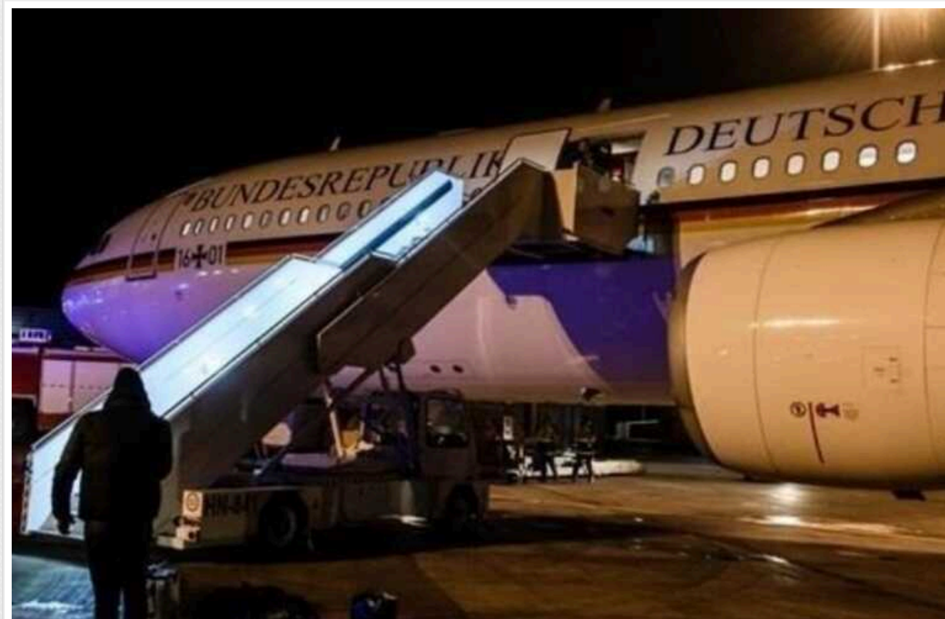
Літаку з главою МЗС Німеччини не дозволили пролетіти над Еритреєю

Літак із міністеркою закордонних справ Німеччини Анналеною Бербок на шляху до африканської країни Джибуті здійснив незаплановану посадку в Саудівській Аравії.