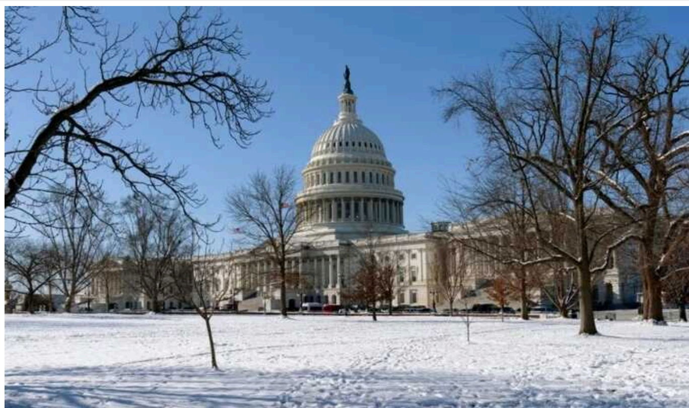
Сенат США щодня "на крок ближче" до рішення щодо допомоги Україні, – Чак Шумер

У Сенаті США продовжуються дискусії щодо прийняття пакету допомоги Україні, Ізраїлю та Тайваню та посилення безпеки на південному кордоні США.