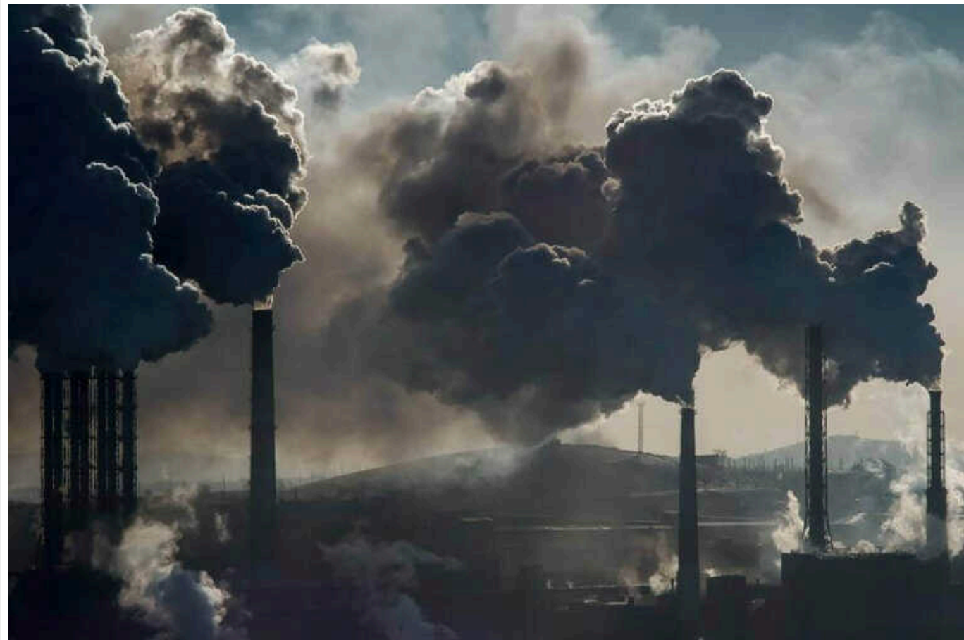
The Guardian: Викиди від викопного палива в Євросоюзі сягнули мінімуму за 60 років

У Європейському Союзі зафіксували на 8% менше викиди вуглекислого газу зі спаленого викопного палива у 2023 році, ніж у 2022 році, таким чином знизивши ці викиди до найнижчого рівня за 60 років.