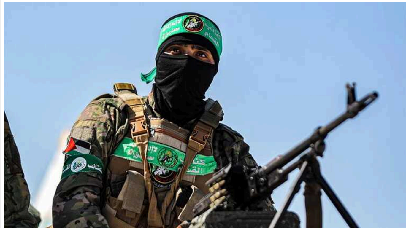
ХАМАС отримує до 12 мільйонів доларів на місяць від нібито благодійних організацій, – Bloomberg

Ізраїль заявляє, що ХАМАС отримує онлайн-пожертви через групи, які видають себе за благодійні організації Гази. Йдеться про суму від 8 до 12 мільйонів доларів на місяць.