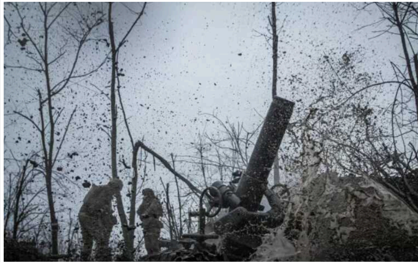
На окупованій Донеччині помітили найманців з Малайзії, які приїхали воювати, – ЦНС