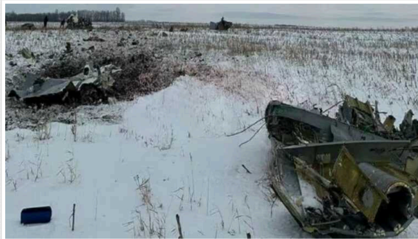
РФ використовує катастрофу Іл-76, щоб посягти в Україні невдоволення, – ISW

Російські суб'єкти інформаційного простору використовують катастрофу Іл-76 для того, щоб посягти внутрішнє невдоволення в Україні та підірвати бажання Заходу продовжувати надавати військову підтримку Україні.