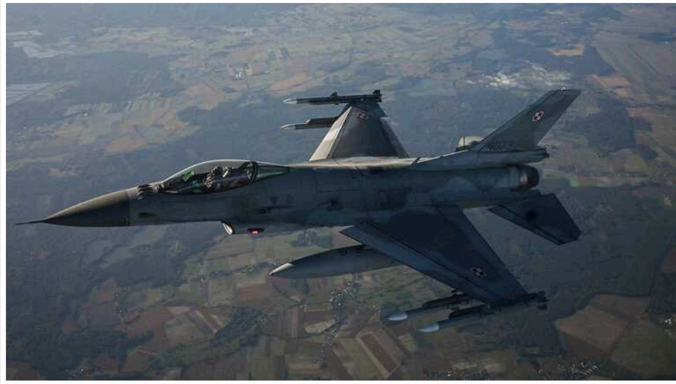
Байден закликав Конгрес "без зволікань" схвалити продаж Туреччині F-16, – Reuters

Президент США Джо Байден направив листа лідерам ключових комітетів Конгресу, в якому повідомив про продаж F-16 Туреччині.