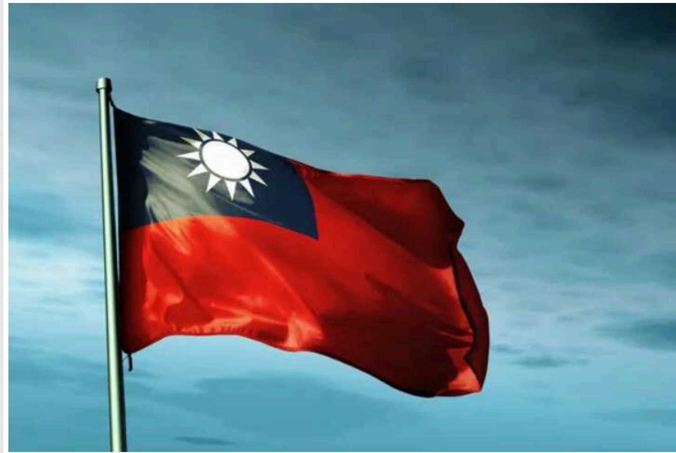
Новообраний президент Тайваню сподівається на підтримку США

Лай Цзіньте, обраний президент Тайваню, висловив сподівання на продовження твердої підтримки з боку США. Він зустрівся з першою групою американських законодавців, які відвідали Тайбей після перемоги на виборах.