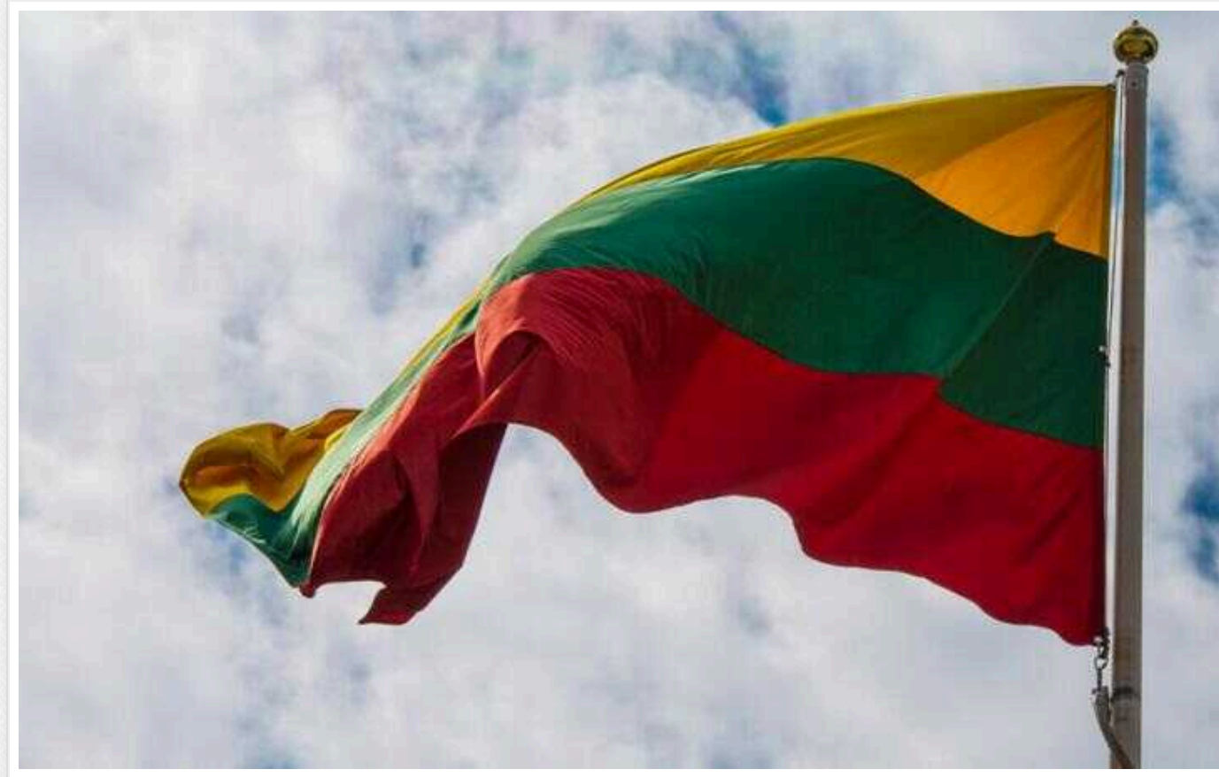
Литовський уряд заборонив своїм військовим відвідувати Росію та Білорусь

Уряд Литви сьогодні, 24 січня, заборонив військовослужбовцям та статутним службовцям відвідувати Росію, Білорусь та Китай поза службою.