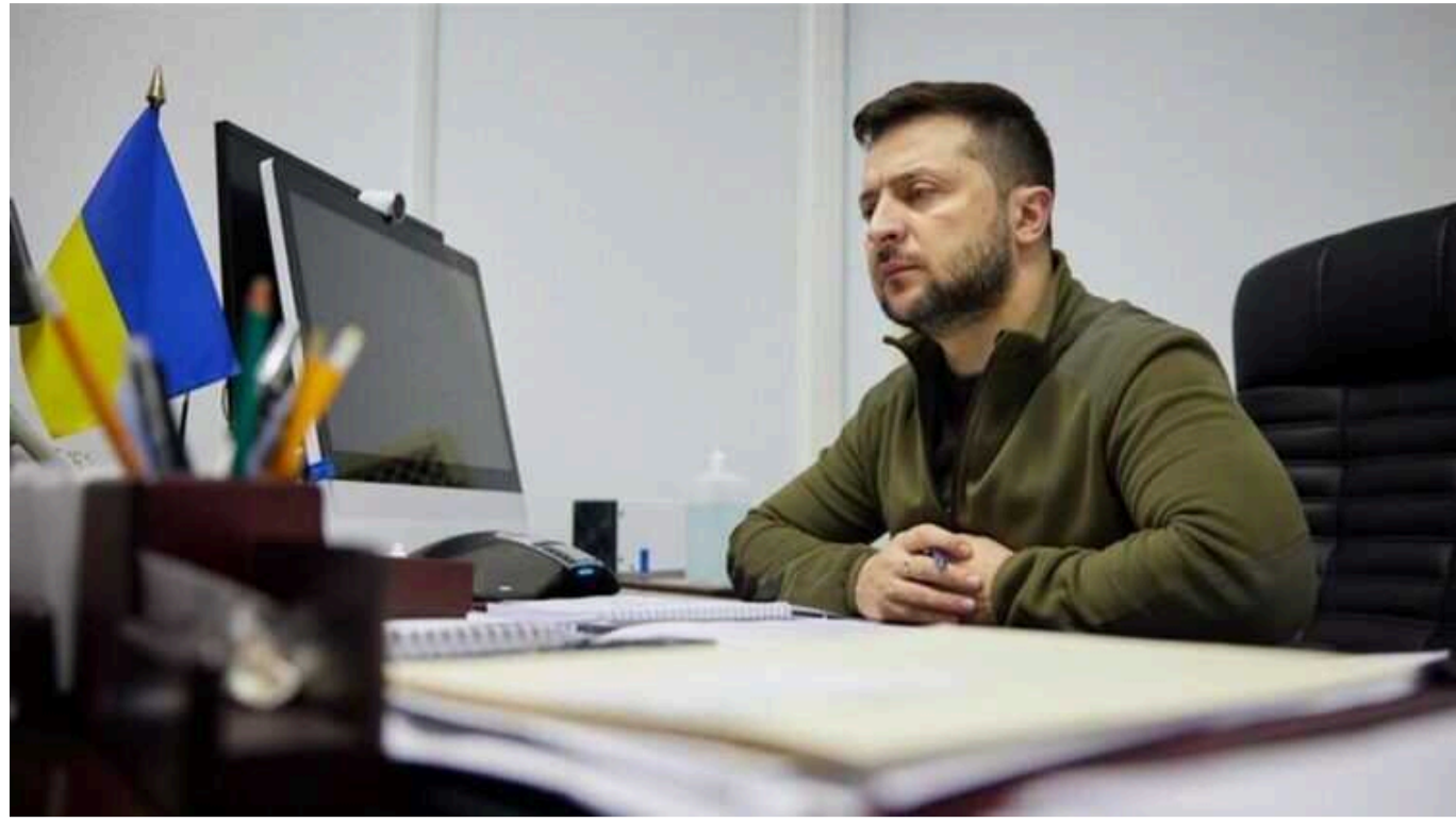
Україна ніколи не була країною-агресоркою: указ Зеленського не про "звільнення" територій РФ