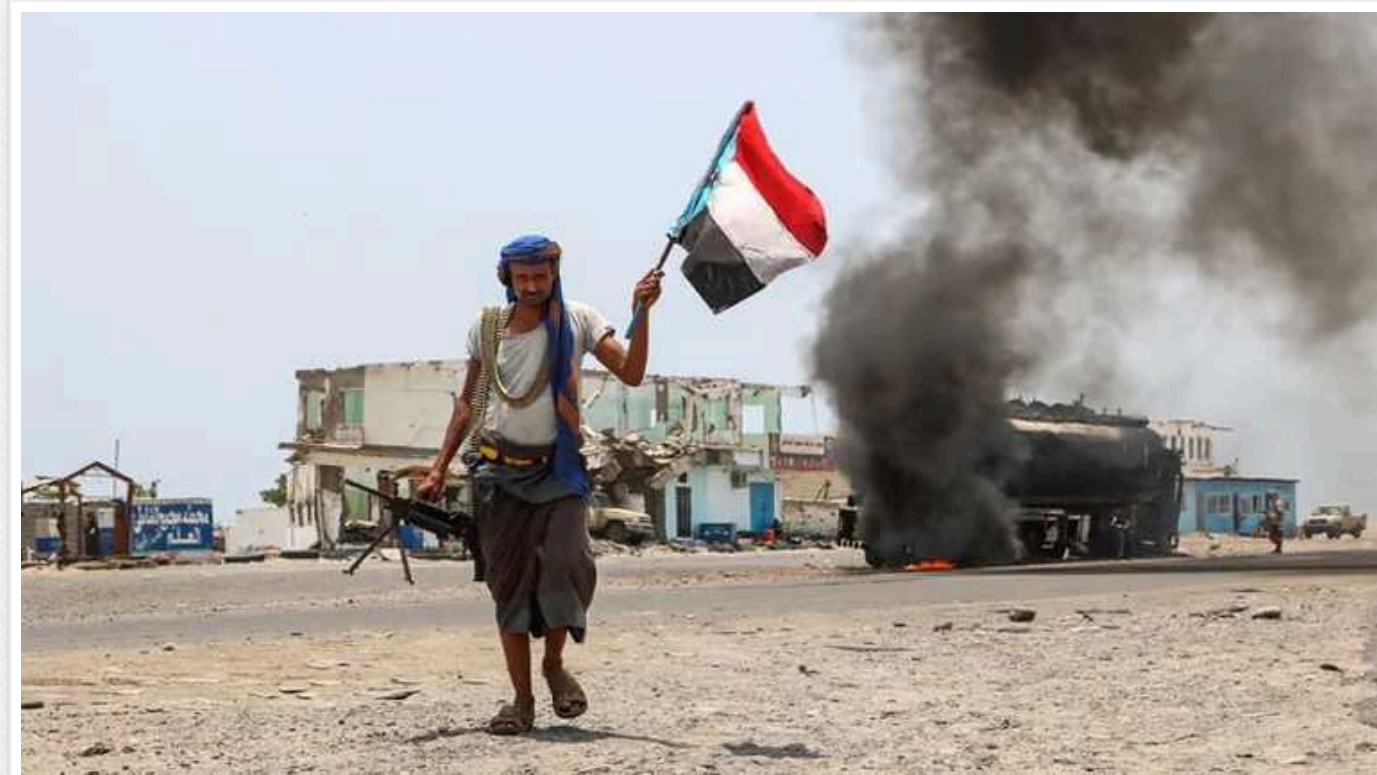
Війна в Ємені підводить глобальну економіку до масштабної кризи: таких втрат не було 70 років

Через війну в Ємені світова торгівля опинилася перед обличчям серйозної кризи. Вся справа в логістиці – перебої в русі суден через Суецький канал спровокували найбільше за останні десятиліття перенаправлення торгових перевезень, і це завдає шкоди глобальному ланцюжку поставок. Втрати можуть бути порівняні з Суецькою кризою майже 70-річної давнини, коли в 1956-му канал закривався для кораблів на п'ять місяців.