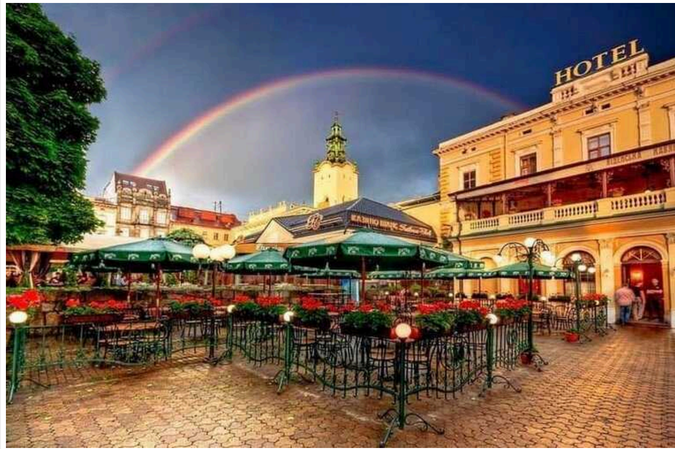
У Львові власників культової кав'ярні оштрафували через порушення закону "Про охорону культурної спадщини"

Міська рада підписала постанову про фінансові санкції через порушення закону "Про охорону культурної спадщини".