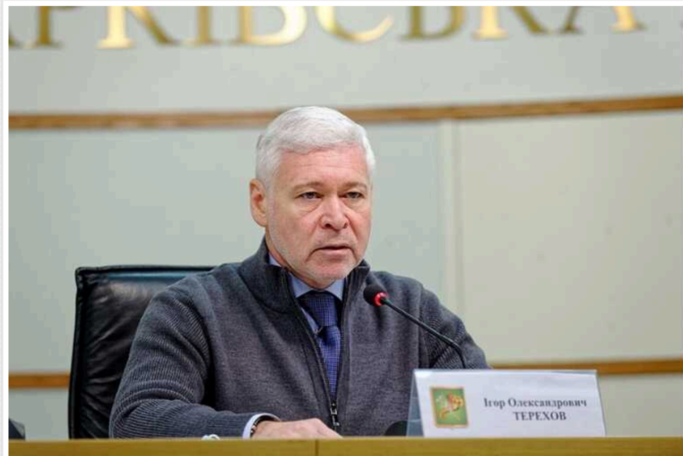
Мер Харкова Терехов після російських обстрілів запропонував перейменувати вулицю Пушкінську на Сковороди

Мер Харкова Ігор Терехов пропонує перейменувати вулицю Пушкінську у центрі міста на вулицю Григорія Сковороди.