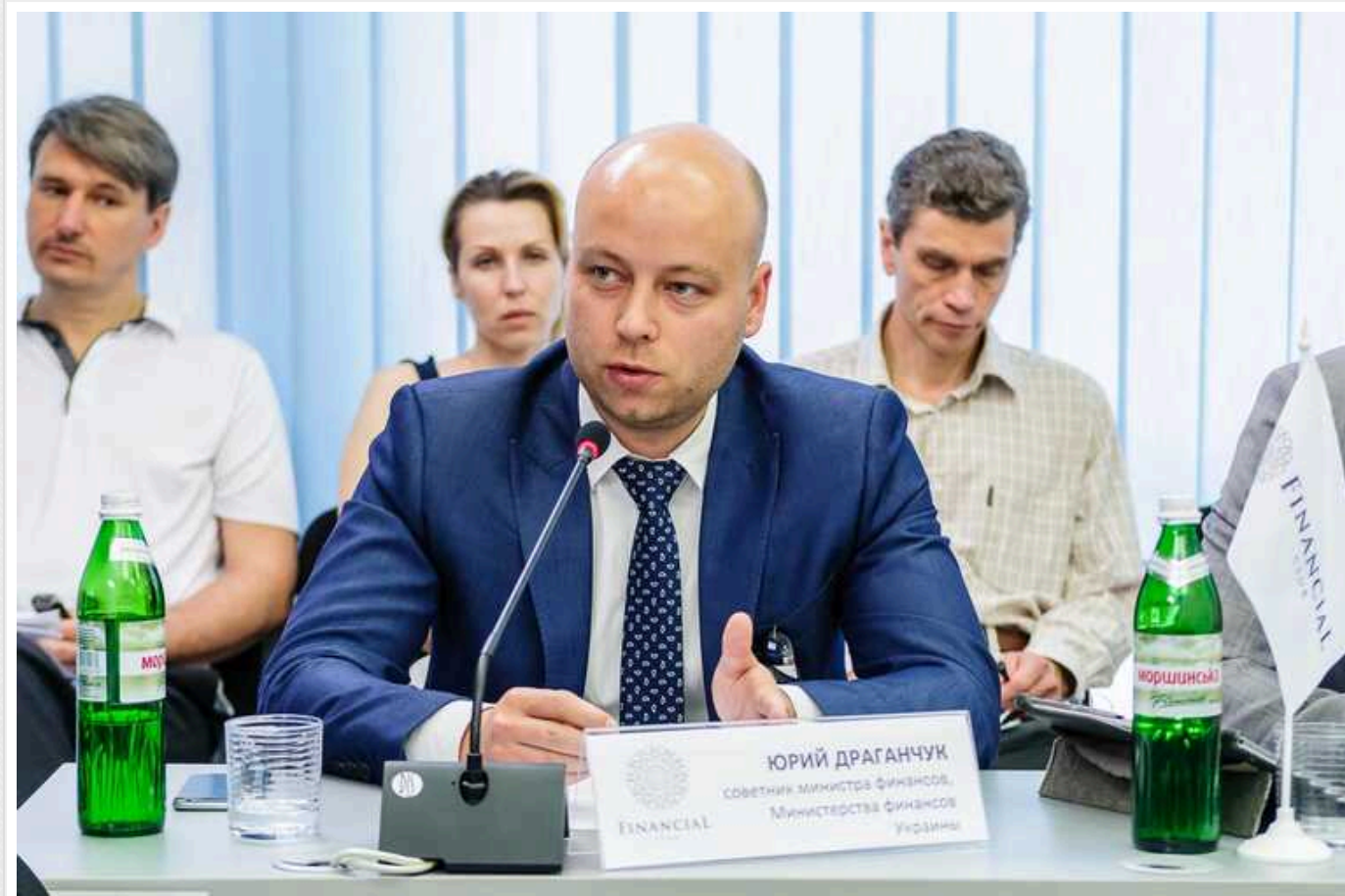
Іноземні інвестори готові приватизувати два українські держбанки

Іноземні інвестори висловили зацікавленість в приватизації двох українських державних банків - "Укргазбанку" та "Сенс банку".