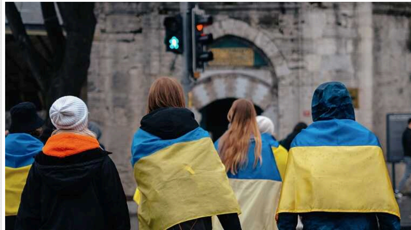
Україна обговорює з ЄС майбутнє повернення українських біженців, – Politico

Україна проводить "попередні переговори" з офіційними особами ЄС, щоб забезпечити повернення додому мільйонів українських біженців уже наступного року.