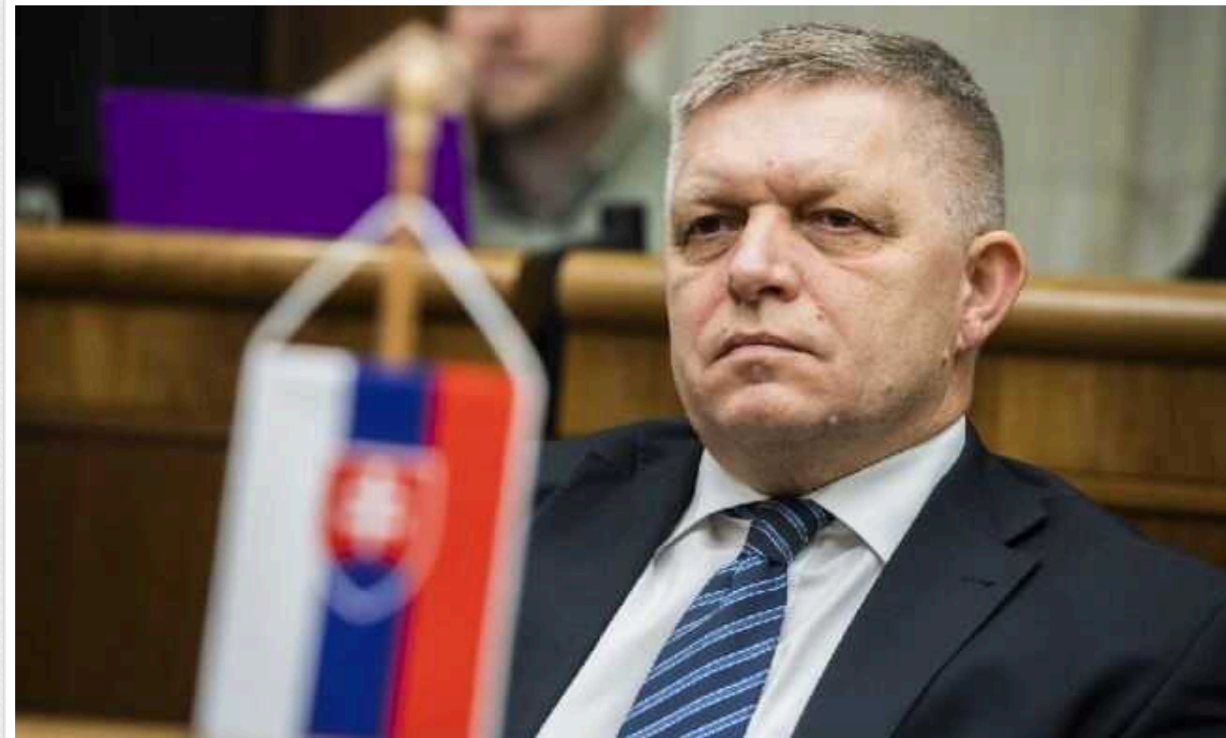
Роберт Фіцо заявив, що наступного року Україна буде відкрита для транзиту російського газу

"Україна відкрита для транзиту російського газу після 2024 року, роботу над деталями угоди може бути завершено найближчим часом", - Роберт Фіцо.