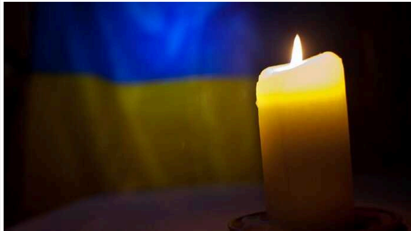
Двох операторів дронів кинули на штурм як піхоту, і вони загинули – журналіст звернувся до Залужного