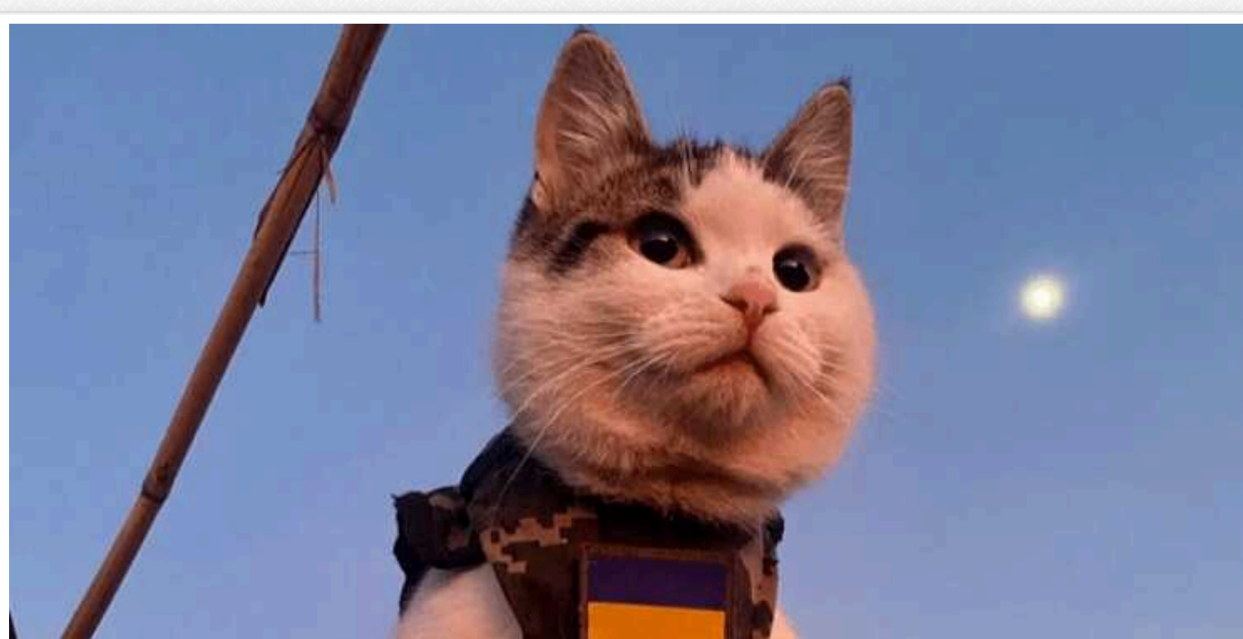
Бойові коти: Україна залучає домашніх улюбленців до боротьби проти РФ, — Politico

Коти допомагають українським солдатам справлятися зі стресом, а також ловлять мишей в окопах, допомагаючи своїм господарям.