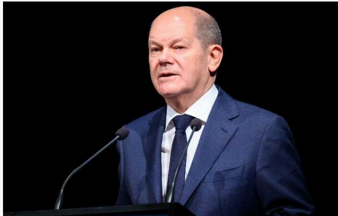
Німеччина та Україна близькі до узгодження "гарантій безпеки", - Шольц

Канцлер Німеччини Олаф Шольц заявив, що Берлін та Київ можуть незабаром узгодити угоду про зобов'язання з безпеки відповідно до Рамкової декларації "Групи семи", прийнятої на саміті НАТО в липні 2023 року.