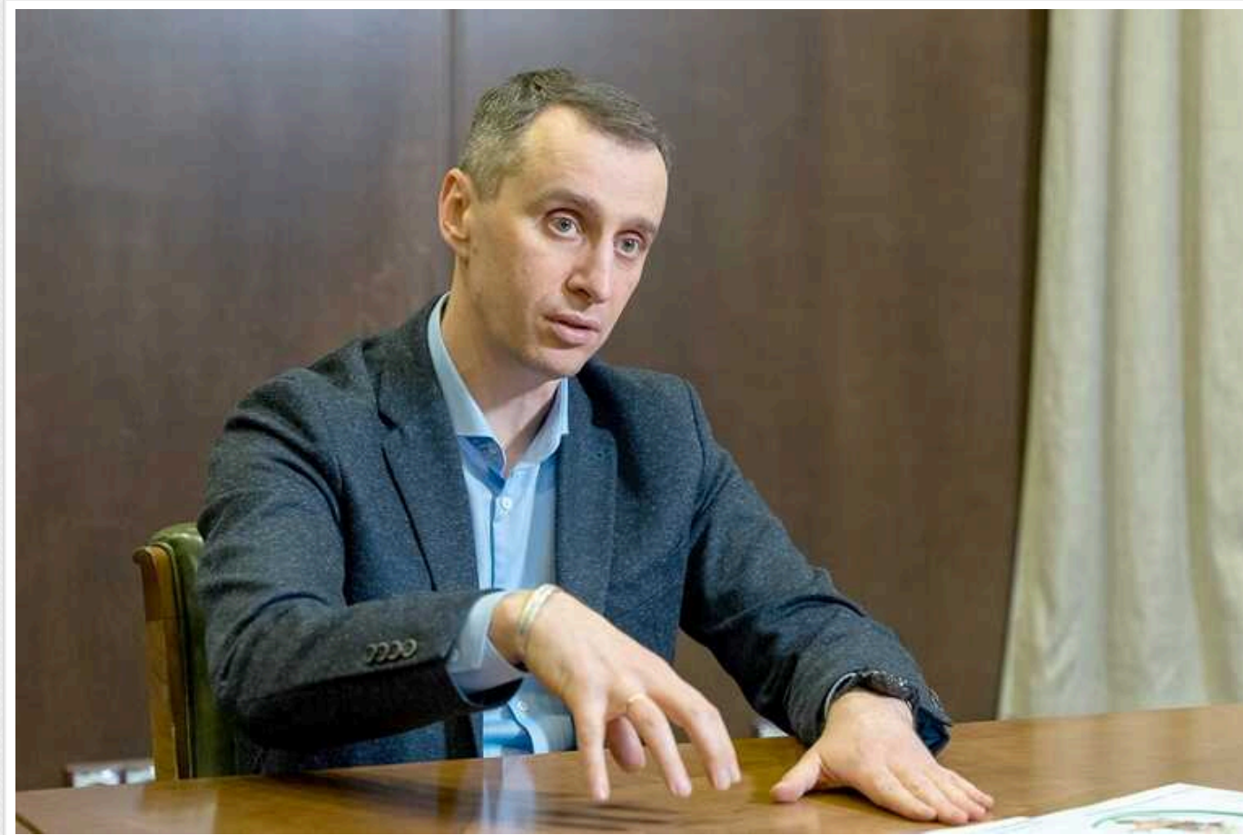
У ВООЗ закликали готуватися до нової гіпотетичної пандемії

Хвороба Х – це потенційна загроза, яку вчені всього світу спільно намагаються зачасно спрогнозувати. Це робиться для того, щоб миттєво застосувати всі наявні ресурси для збереження життя людей.