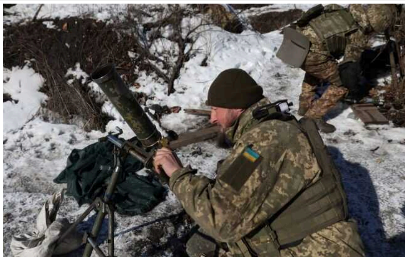
Ситуація на фронті: ворог завдав 2 ракетних і 53 авіаційні удари, здійснив 53 обстріли з реактивних систем залпового вогню

Українські воїни утримують позиції на лівобережжі Дніпра, відбили атаки росіян поблизу Авдіївки (Донецька область) та вразили 7 районів зосередження особового складу супротивника.