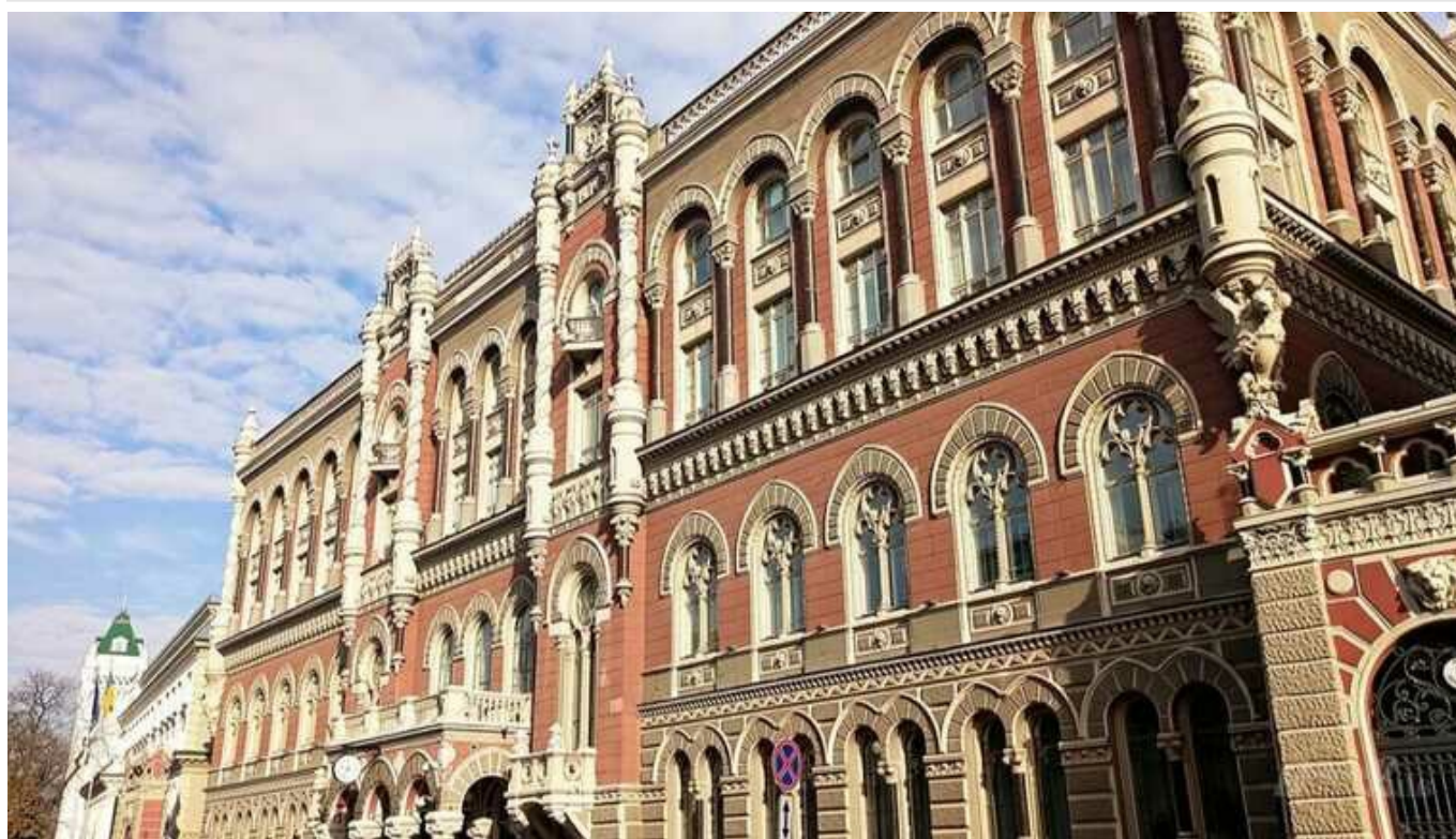
Нацбанк анулював ліцензії п'ятьом небанківським установам

Національний банк анулював ліцензії п'яти небанківським установам, три – виключив з Державного реєстру фінансових установ та одну – з Реєстру осіб, які не є фінансовими установами, але мають право надавати окремі фінансові послуги.