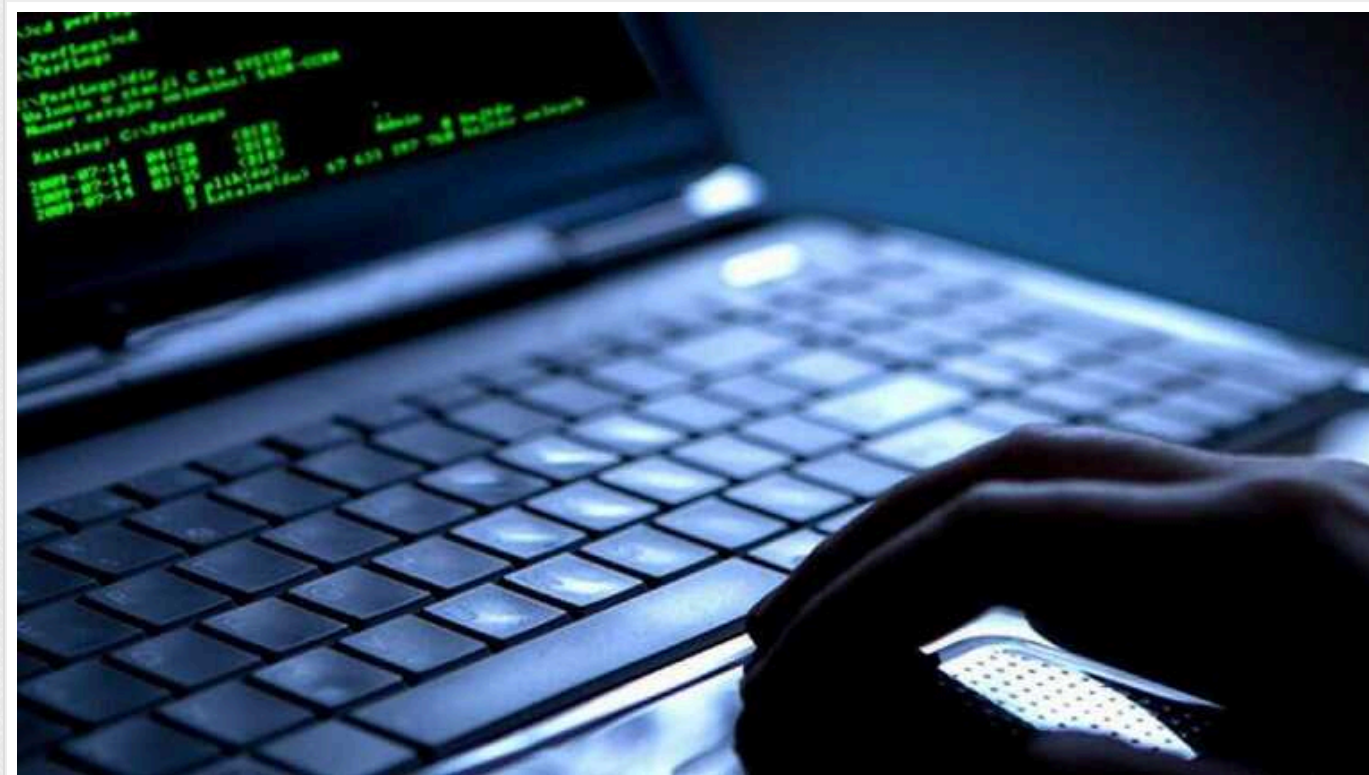
Данія виділила на кіберзахист у ЗСУ та Міноборони 12 мільйонів євро

Данія виділила Україні понад 12 млн євро на посилення кіберзахисту у силових структурах. Зокрема йдеться про кібербезпеку в ЗСУ та Міністерстві оборони, повідомили у пресслужбі Міноборони Данії у середу, 24 січня.