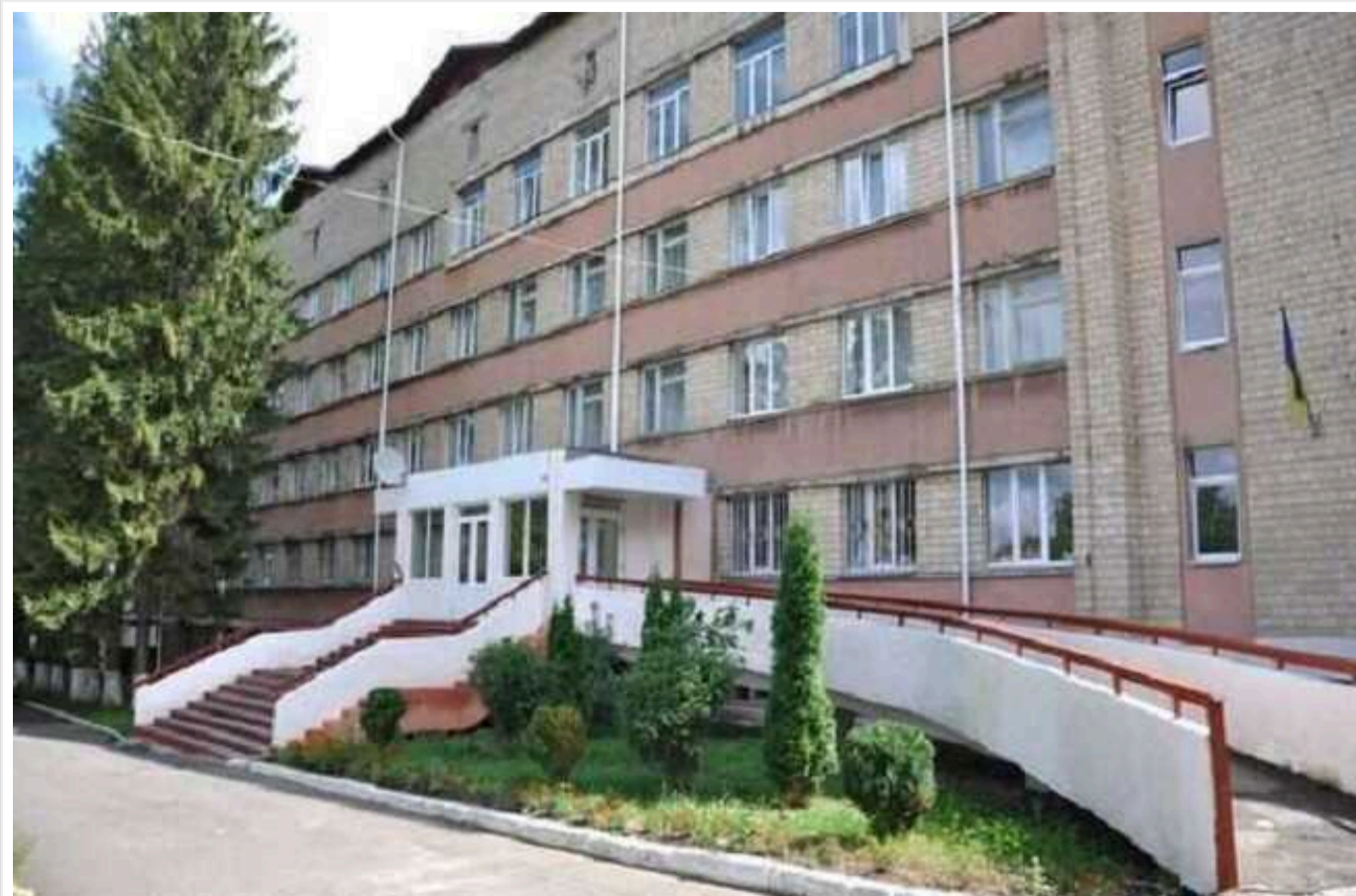
У Чернівцях відремонтують обласний госпіталь ветеранів війни за понад 283 мільйони гривень: раніше помічали, що фірма завищує ціни на матеріали

У Чернівцях за понад 283 млн грн проведуть реконструкцію в приміщеннях обласного госпіталю ветеранів війни. Тендер, який оголосив департамент капітального будівництва Чернівецької обласної державної адміністрації, виграла фірма, яку раніше помічали на завищенні ціні на будматеріали.