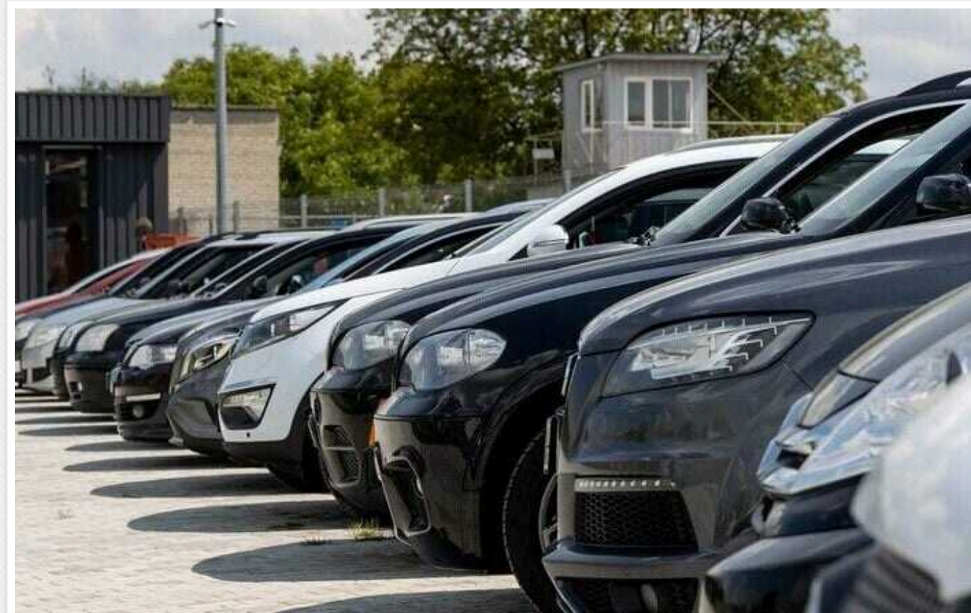
Латвія передасть Україні ще одну партію авто, конфіскованих у нетверезих водіїв

Латвія передасть Україні ще 14 автомобілів, конфіскованих у нетверезих водіїв. Країна партнер віддасть транспорт безкоштовно з метою допомогти у запобіганні наслідків надзвичайної ситуації, пов'язаної з бойовими діями, та підтримати українське суспільство.