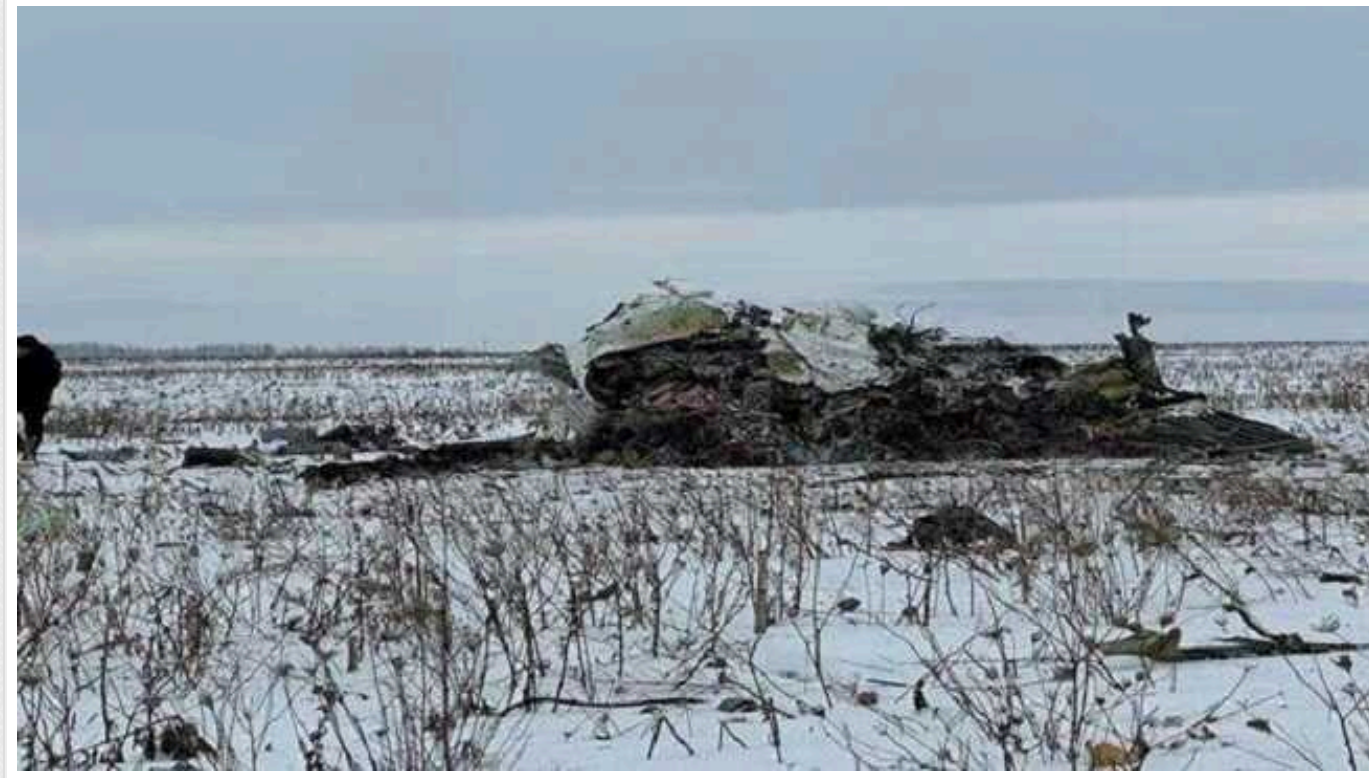
Що відомо про маршрут літака Іл-76, який розбився в Белгородській області: нещодавно був помічений поблизу Сирії

Російський військово-транспортний літак Іл-76, що розбився 24 січня на території Белгородської області, цього дня міг повернутися зі ще одного польоту. Імовірно, саме цей літак, згідно з даними системи Flightradar, днями було помічено поблизу Сирії.