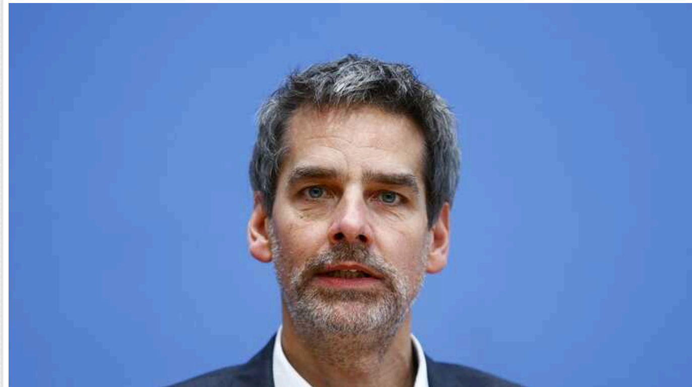
Німеччина закликала партнерів посилити військову підтримку України: "Війна перебуває в критичній фазі"

Німеччина в бюджеті на 2024 рік зарезервувала на військову допомогу Україні 7,5 млрд євро, вдвічі більше, ніж у попередньому. Проте цього замало, саме тому уряд ФРН закликає партнерів збільшити допомогу Україні.