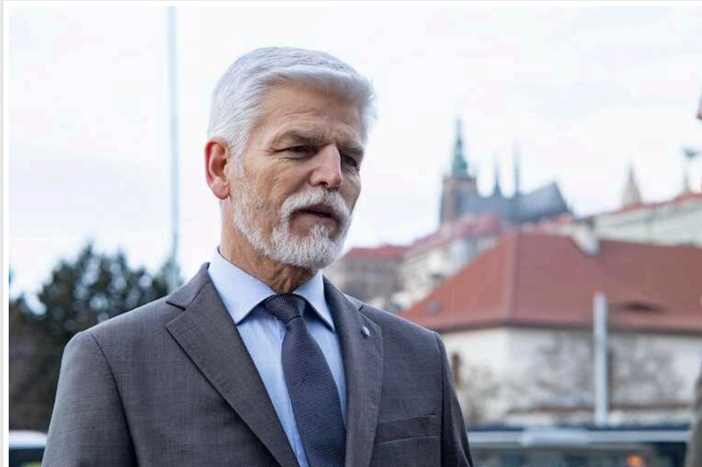
Петр Павел: Україна не поверне окуповані території найближчим часом

За словами Петра Павела, Росія – непростий противник, тому варто дивитися на війну в Україні "реалістично, а не в рожевих окулярах", як траплялося раніше.