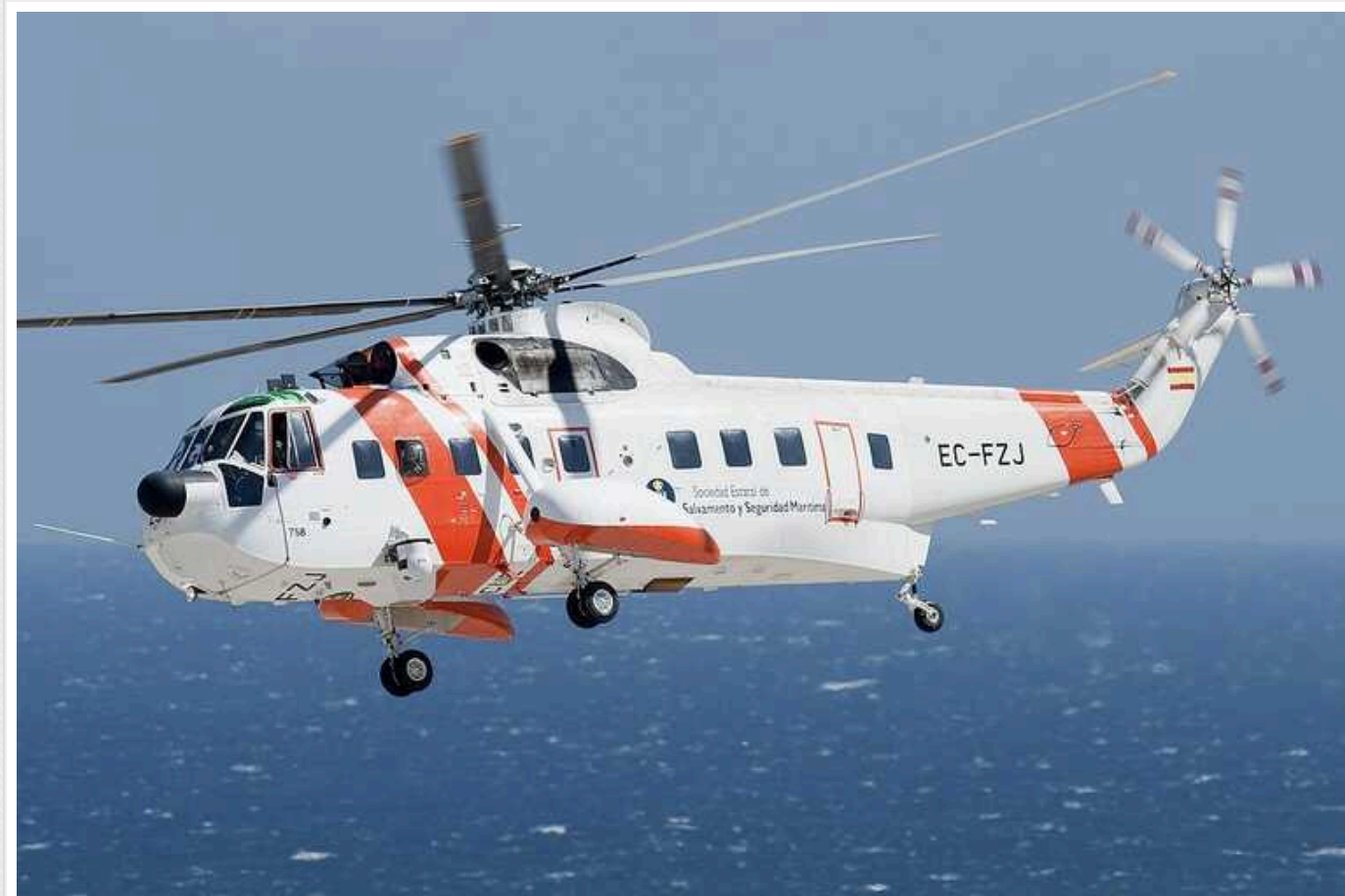
У Міноборони ФРН назвали терміни передачі Україні обіцяних гелікоптерів Sea King

За словами спікера відомства Арно Коллаца, постачання гелікоптерів не знизить боєздатність Бундесверу, оскільки їх замінять іншою моделлю – Sea Lion.