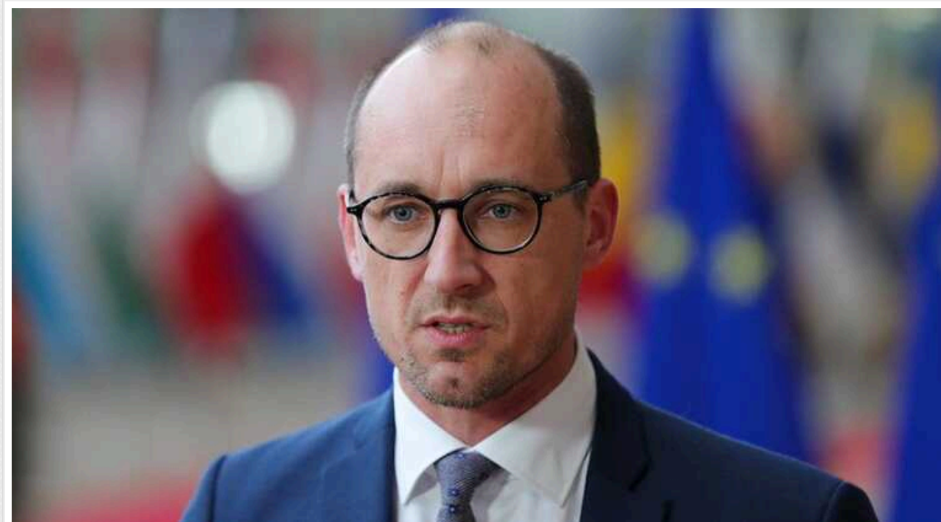
У Бельгії заявили про відсутність у ЄС плану Б на випадок блокування виділення коштів Україні

Міністр фінансів Бельгії Вінсент Ван Петегем заявив, що Євросоюз не має "плану Б" на випадок, якщо Угорщина знову заблокує виділення 50 млрд євро Україні.