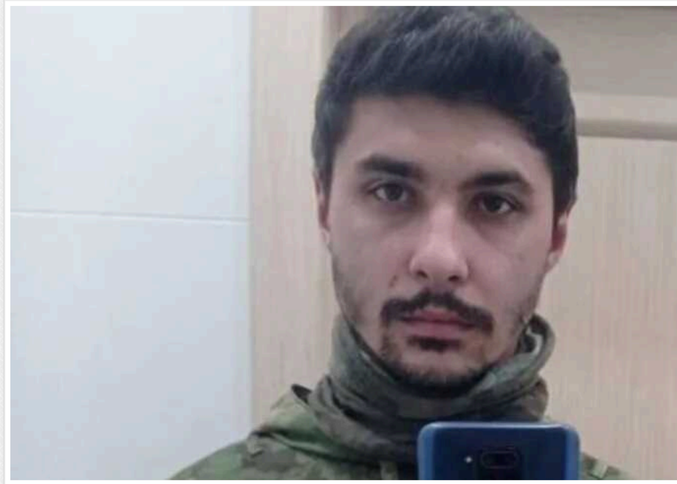
Працівнику ФСБ, який курирував фільтраційний табір на Запоріжжі, оголосили підозру: там утримували до сотні людей

28-річному російському окупанту, співробітнику ФСБ РФ, оголосили про підозру в порушенні законів і звичаїв війни (ст. 438 КК України), за що загрожує до 15 років позбавлення волі. Злочинець є куратором фільтраційного табору, організованого загарбниками в місті Кам'янка-Дніпровська Запорізької області в будівлі ізолятора тимчасового утримання №2 відділку місцевої поліції.