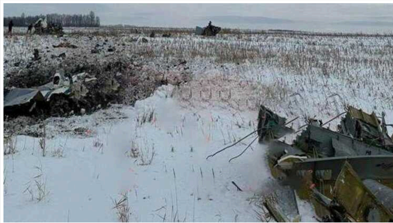
Генштаб ЗСУ підтвердив збиття Іл-76

У ЗСУ дали відповідь хто збив російський Іл-76, що він перевозив й що й надали будуть нищити російські літаки.