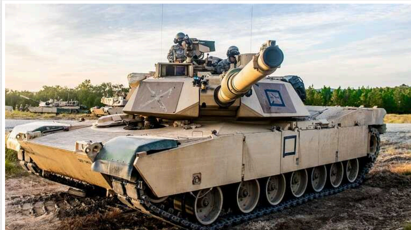
У Пентагоні пояснили, яку зброю не отримає Україна: "Очевидно, що загроза реальна"

Для України продовжує існувати загроза програву у війні з Росією, зауважив речник Пентагону Патрік Райдер. Водночас на "Рамштайн-18" США вперше не змогли надати ЗСУ пакет військової допомоги.